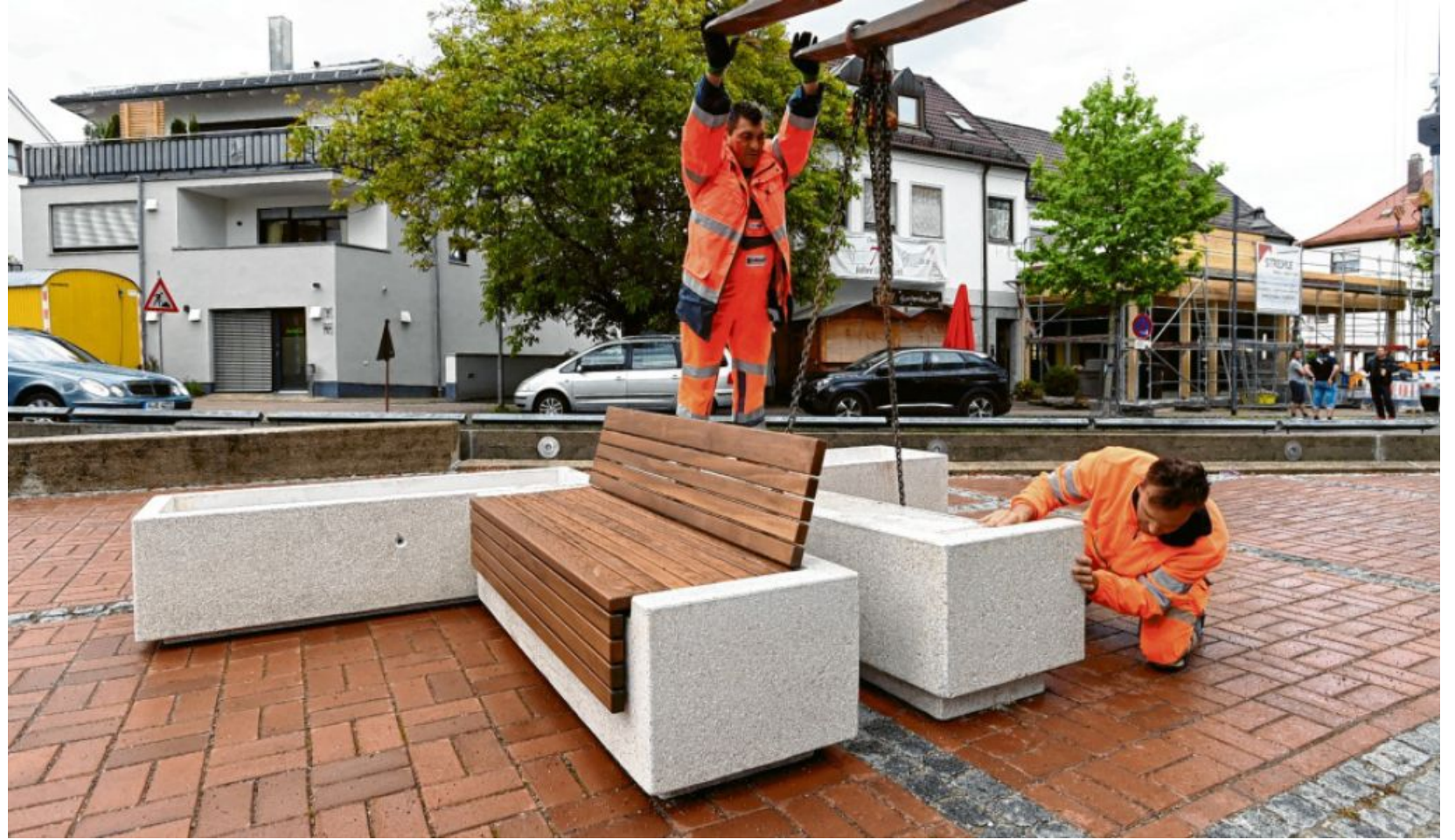
So schön wird es jetzt am Dreieck in Steppach: Endlich sind die neuen Sitzbänke da. Lieferverzögerungen hatten dafür gesorgt, dass sich das Projekt länger als geplant hinausgezogen hatte.